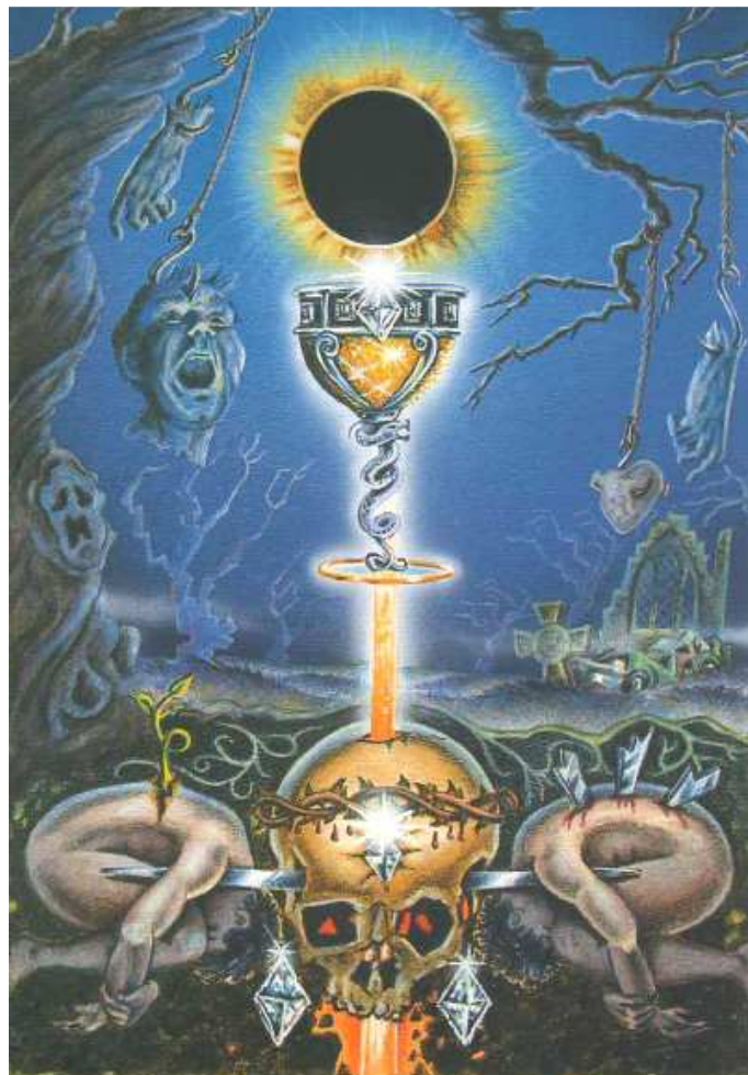
'He is tortured, slain and buried, his body dismembered.'

mislukking. Hij voelt zich waardeloos. Hij gaat op zoek naar compensatie in de vorm van alcohol, sigaretten en er is een grote behoefte om in de zon te zitten. Hij kan zichzelf niet uiten en er is geen route om te ontsnappen aan de kwellende twijfel en de fatale stroom waar hij in zit. Het kan leiden tot sterk suïcidale neigingen. Hij heeft een goed gevoel voor perfectie, puurheid en virtuositeit maar het is des te schrijnender dat hij die nooit kan bereiken. Er zijn veel overeenkomsten met het beeld van Aurum metallicum. Mind: misbruik, mishandeling en wreedheid zijn niet