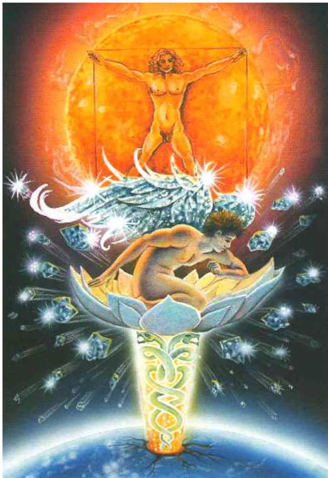
'The spirit of balance and integration. He has become whole, the maker of his destiny.'

De diamant die in de natuur gevonden wordt is een mengsel van twee verschillende carbon isotopen ^{12}\text{C} (meest voorkomend) en